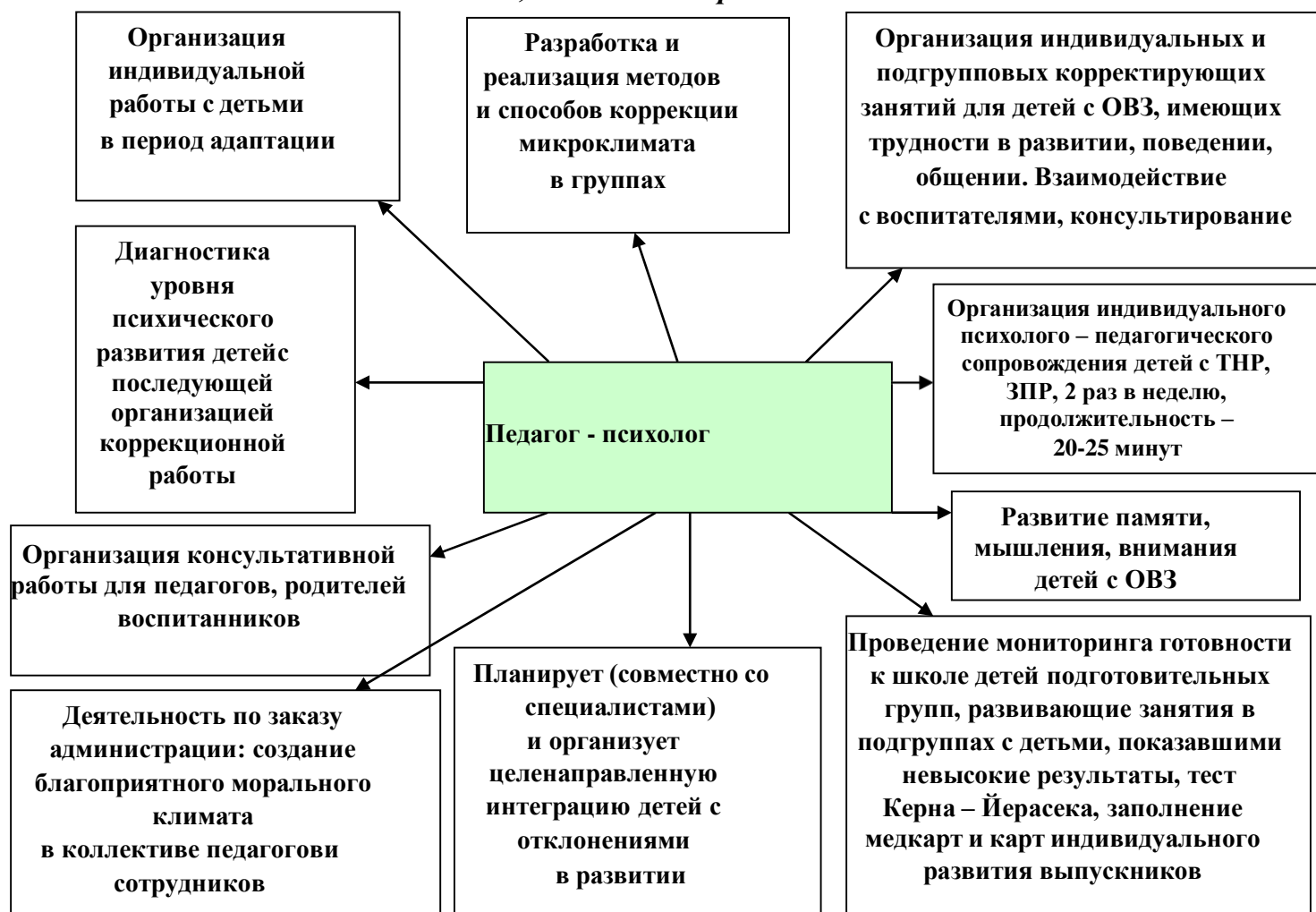
Рис. 2 «Педагог - психолог, основные направления деятельности»